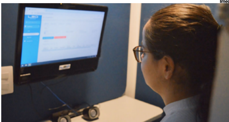
Profissional do HEF realiza atendimento a paciente na cabine de telemedicina da unidade

O serviço começou no dia 29 de abril deste ano, inicialmente funcionando das 10h às 16h. A partir de 27 de maio, o horário de funcionamento foi ampliado para das 7h às 19h, oferecendo maior flexibilidade e acesso aos serviços de saúde. Desde sua implementação, o serviço de telemedicina tem realizado, em média, mais de 200 atendimentos mensais, destacando-se como uma so-