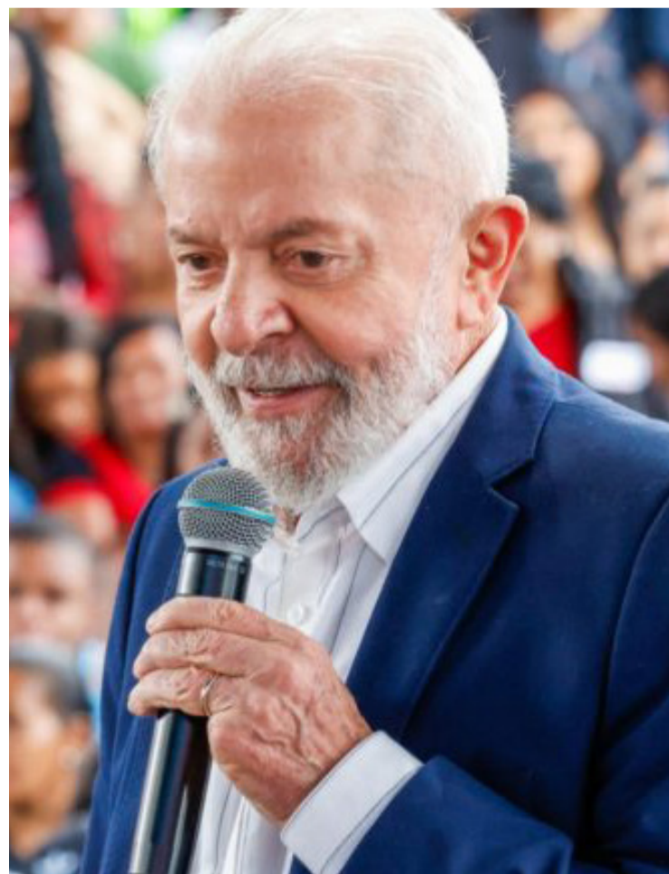
Lula da Silva: dificuldades em reduzir gastos públicos

"Começamos aqui a discutir 2025, a agenda de gastos. O que a gente pediu foi uma intensificação dos trabalhos", afirmou Haddad há pouco mais de três semanas. "Nós temos um dever de casa agora sobre o lado das despesas."