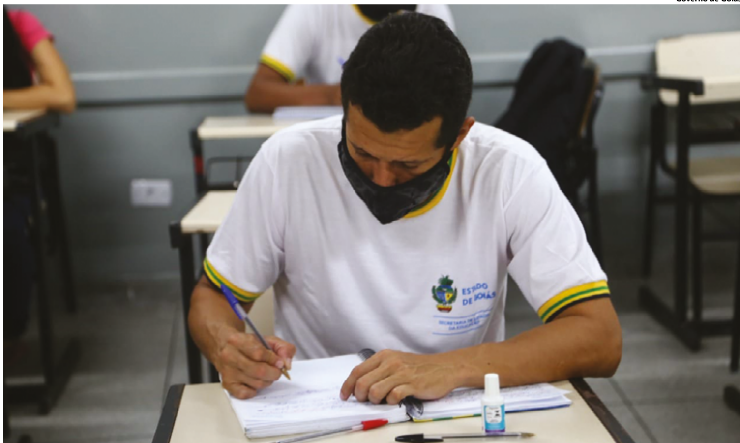
Entre os desafios do processo de alfabetização estão as populações idosa, preta e parda, além dos municípios que contam com menos habitantes

Vem ocorrendo um avanço significativo, porém. Os idosos têm se alfabetizado de forma expressiva no País e um pouco acima da média nacional, em Goiás: em 2010, apenas 66,3% dos goianos de 65 anos ou mais