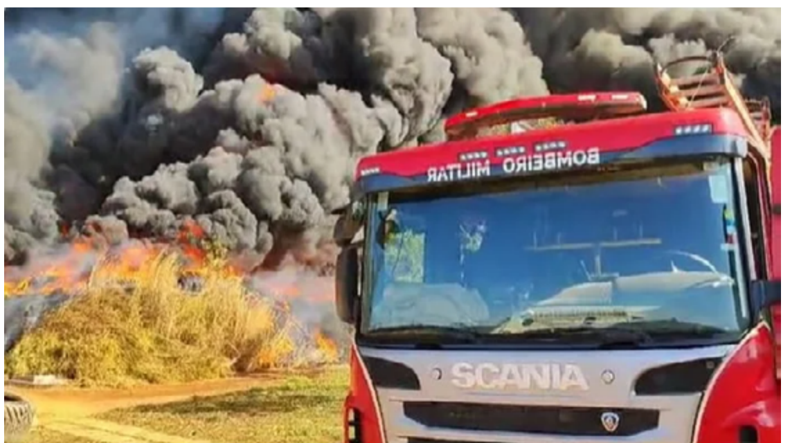
Os bombeiros trabalharam intensamente para controlar o incêndio, utilizando diversas técnicas e estratégias para evitar que o fogo se espalhasse para construções adjacentes

A extensão dos danos materiais ainda está sendo avaliada,