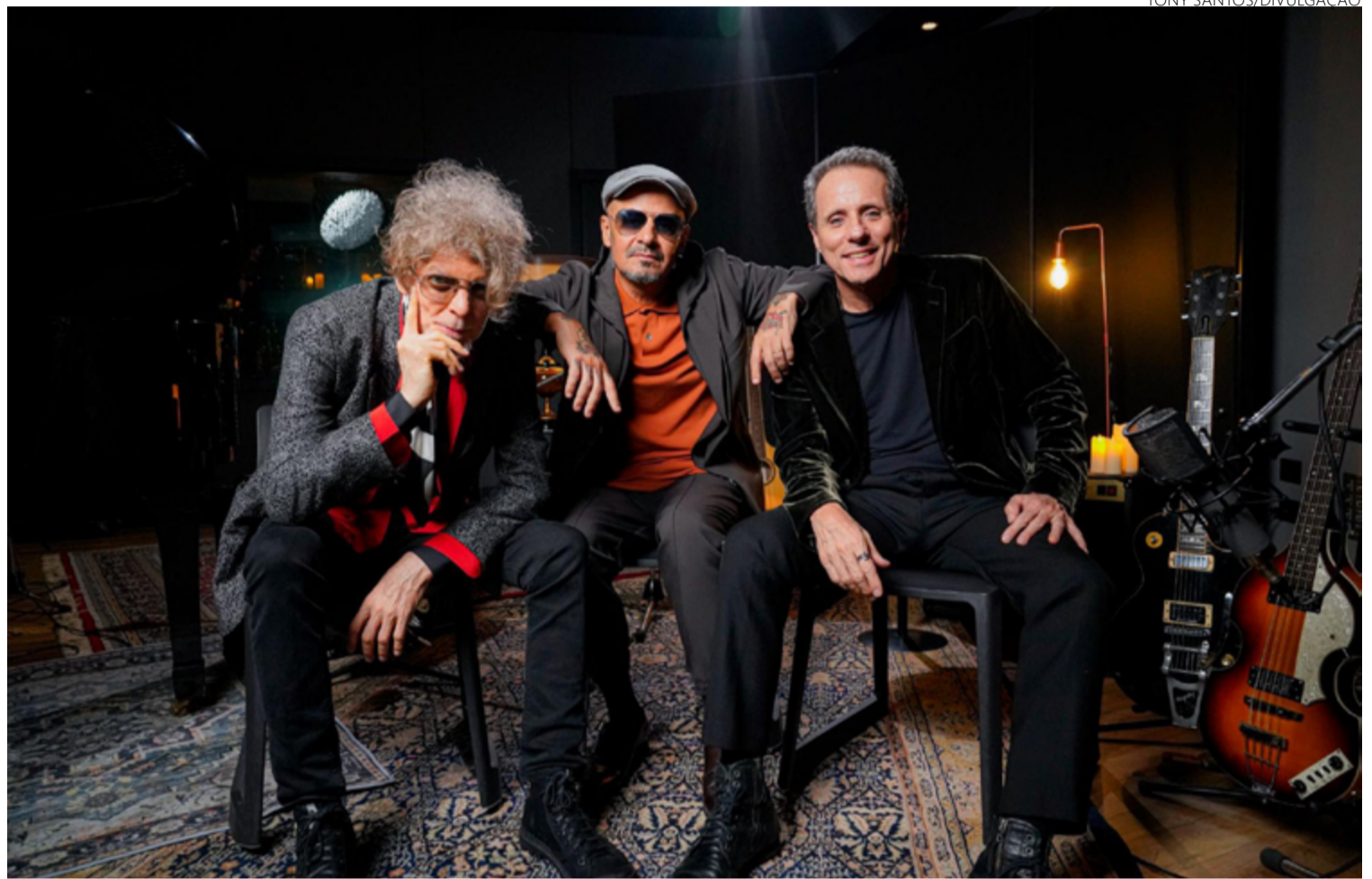
Titãs confirma por que são citados como dádivas da música popular brasileira: novo trabalho mostra banda intimista

“Microfonado” ulula na caixa de som. Titãs, cara, é dádiva irrefutável de nossa música! Enquanto escrevo, penso que poucas bandas na história acenam tão bem para o futuro quanto os paulistanos – agora reduzi-