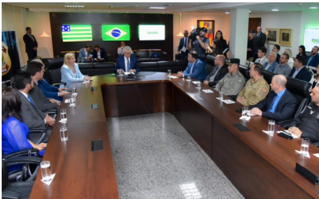
Ronaldo Caiado assina acordo com PF para troca de informações: foco no combate à lavagem de dinheiro e pedofilia