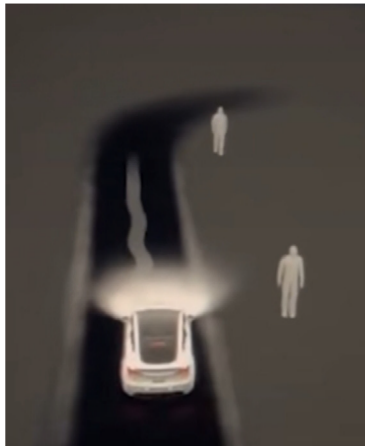
Imagem mostra tela do Tesla capturando imagens de ‘gente’ lá fora, mas na cena real ninguém está próximo

Fato ou ficção, relatos tornaram-se comuns no Tik Tok. Sensor anticolisão do carro aponta presença de ‘fantasmas’