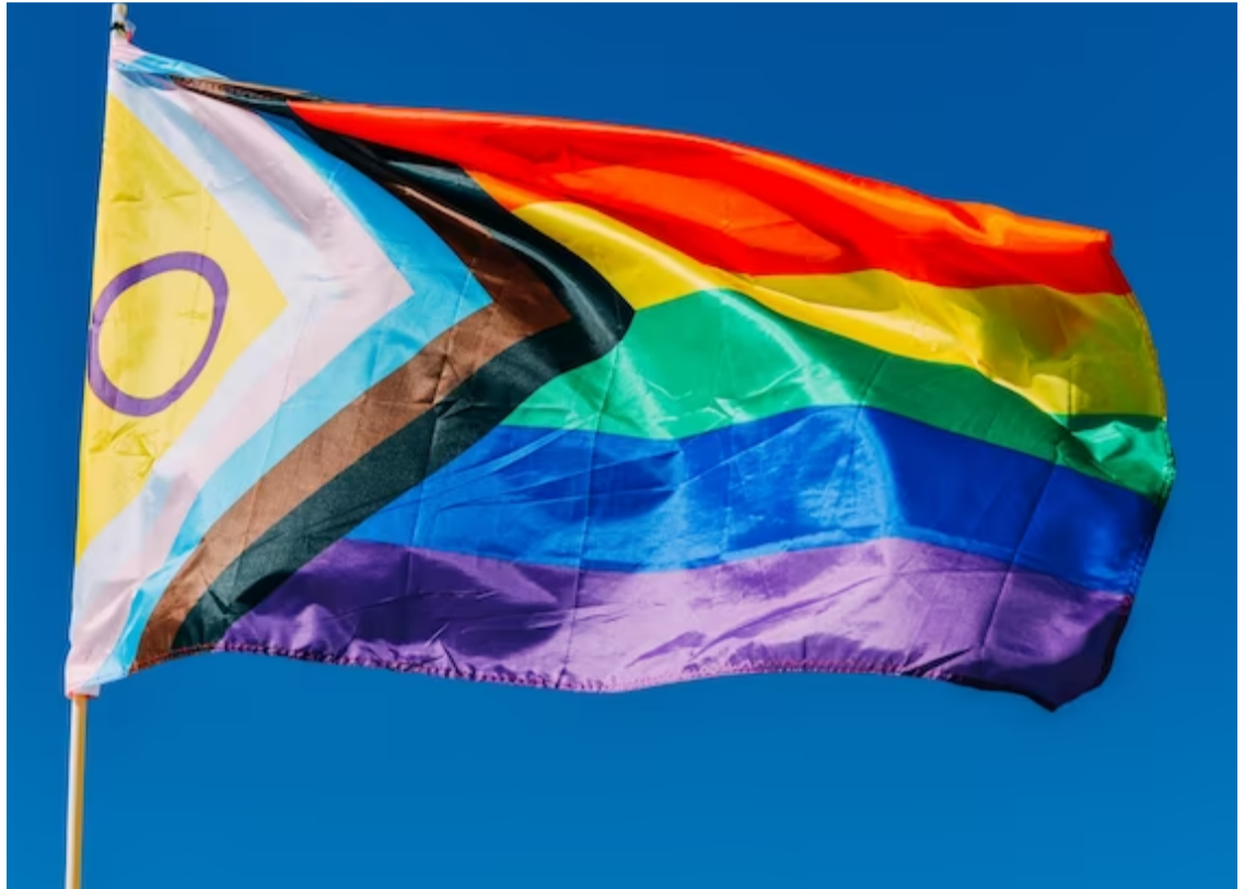
Bandeira que representa a comunidade LGBTQIAPN+

As vítimas podem fazer denúncias na Delegacia Estadual de Atendimento às Vítimas de Crimes Raciais e Intolerância (DEACRI), nas Delegacias de Polícia Civil, Ministério Público, Defensoria Pública, Comitê Estadual de Enfrentamento à LGBTfobia (COMMELG), Delegacia de Proteção à Criança e ao Adolescente e no Centro de Referência Especializado em Assistência Social (CREAS) e Centro de Referência de Assistência Social (CRAS). E também na Polícia Militar, discando 190, e no caso de mulheres, ainda tem o Disque 180.