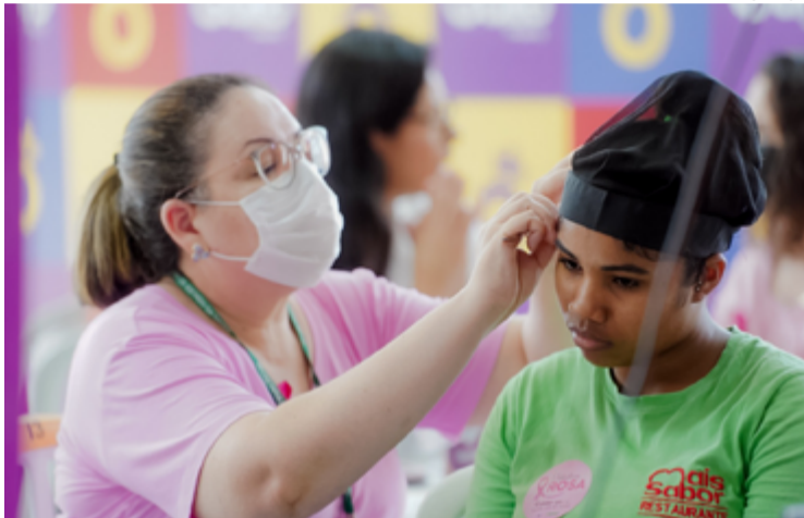
PICs como auriculoterapia auxiliam no equilíbrio emocional e na amenização de sintomas

Modalidades das PICs são oferecidas aos servidores do SUS, promovendo conhecimento profissional, incentivo ao autocuidado e diminuição de sobrecarga