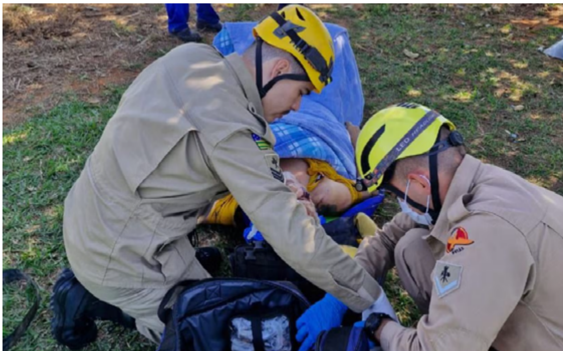
O helicóptero partiu de Brasília com destino à Chapada dos Veadeiros, em Goiás, mas caiu na Lagoa da Jacuba, em Água Fria de Goiás