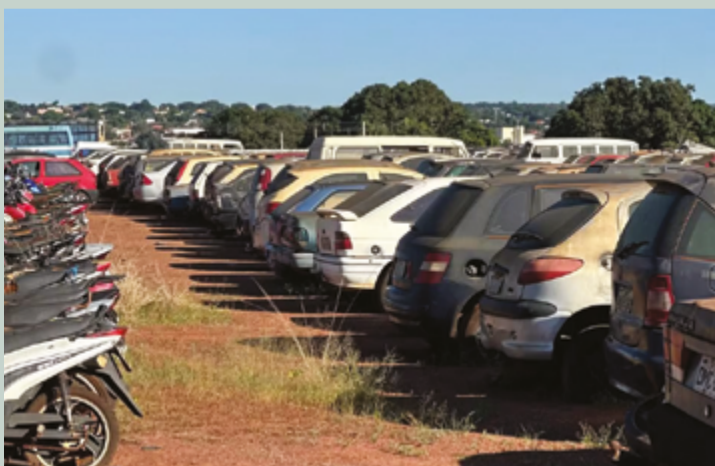
Serão leiloados vários veículos recuperáveis e ainda sucatas aproveitáveis

Pessoas físicas poderão participar do leilão de veículos recuperáveis. Já a aquisição de sucatas só pode ser feita por pessoa jurídica cujo objeto social seja a desmontagem e o comércio de peças e acessórios usados de veícu-