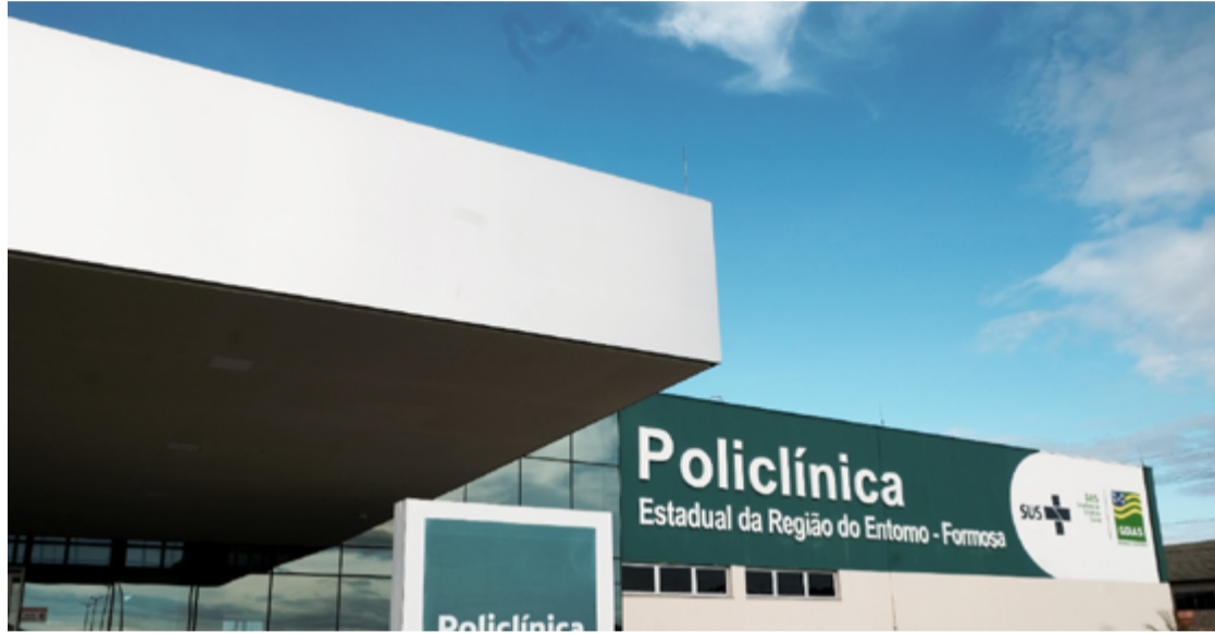
As quatro policlínicas do Estado eram, até então, geridas pelo Instituto CEM, que foi desqualificado como organização social de saúde

As quatro policlínicas do Estado eram, até então, geridas pelo Instituto CEM (ICEM), que foi desqualificado como organização social de saúde