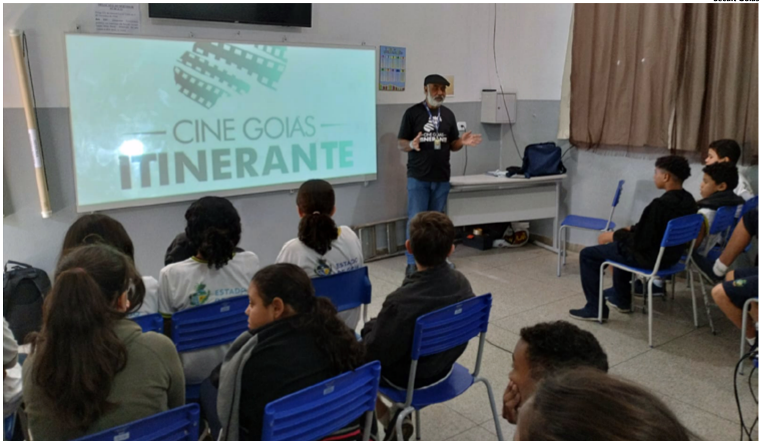
Além da exibição de filmes, o projeto também oferece oficinas temáticas, palestras e cursos sobre audiovisual e meio ambiente.

O Cine Goiás Itinerante tem o objetivo de democratizar o acesso ao audiovisual no interior do Estado, divulgar o cinema ambiental e capacitar profissionais da área. Os pilares do programa são a exibição de filmes que participaram do Festival Internacional de Cinema e Vídeo Ambiental (Fica) e ações de qualificação e promoção da arte cinematográfica para a população. A ini-